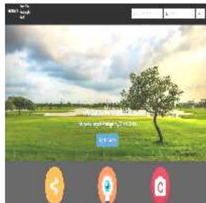
Gambar 1 Halaman Utama

Website yang dibuat berupa tampilan rancangan antarmuka pengguna secara grafis. Tampilan rancangan antarmuka ini berguna untuk menjalankan website photoid Halaman login merupakan halaman depan bagi user yang pertama kali mengakses photoid