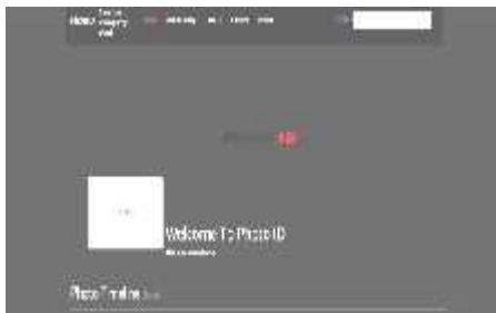
Gambar 4 Upload Galeri