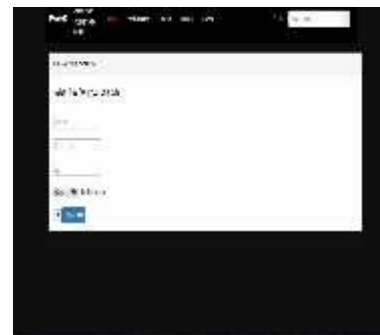
Gambar 7 Halaman Profile Halaman profile merupakan halaman untuk melihat profile saat pertama kita melakukan pendaftaran