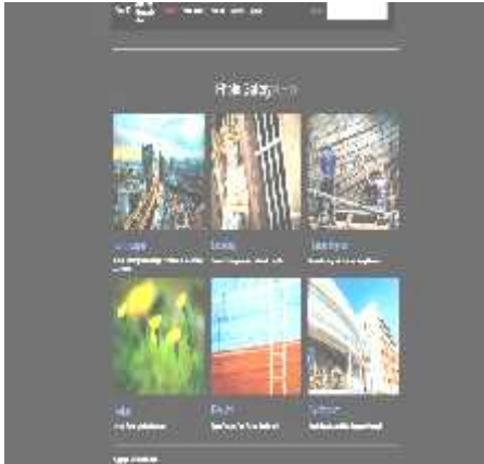
Gambar 3 Halaman How To Halaman how to menampilkan artikel artikel penting mengenai dunia fotografi

Halaman galeri merupakan halaman untuk memperlihatkan hasil hasil foto dari user yang sudah upload ke photo id,user bisa memberikan comment,like dan juga info detail foto